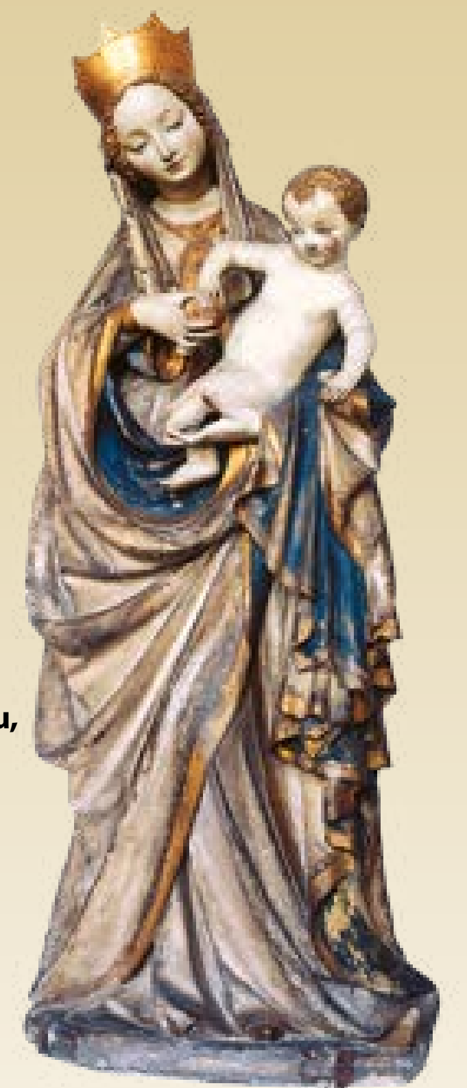
Piękna Madonna z kościoła św. Elżbiety we Wrocławiu, XV wiek