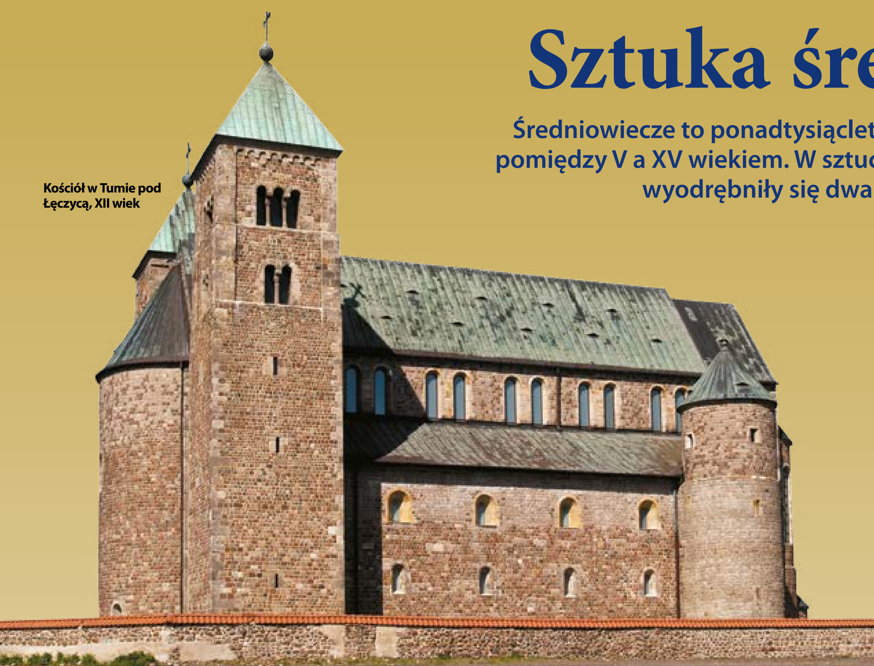
Kościół w Tumie pod Łęczycą, XII wiek

Średniowiecze to ponadtysiącletni okres w dziejach i kulturze Europy pomiędzy V a XV wiekiem. W sztuce średniowiecza w jego dojrzałej fazie wyodrębniły się dwa style: romański i gotycki.