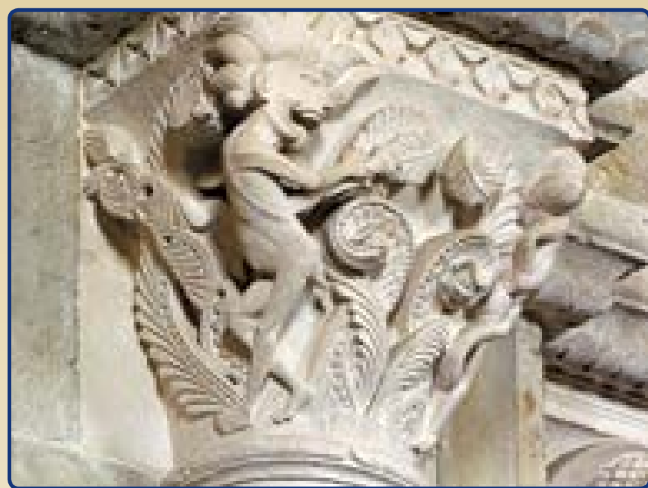
Kolumny z przedstawieniem cnót i przywar z bazyliki w Strzelnie, XII/XIII w.

W tym okresie powstawała głównie architektura sakralna, przede wszystkim kościoły i klasztory. Kościół romański charakteryzują grube, kamienne mury, małe, półkolistie zamknięte okna, masywne, proste i geometryczne formy.