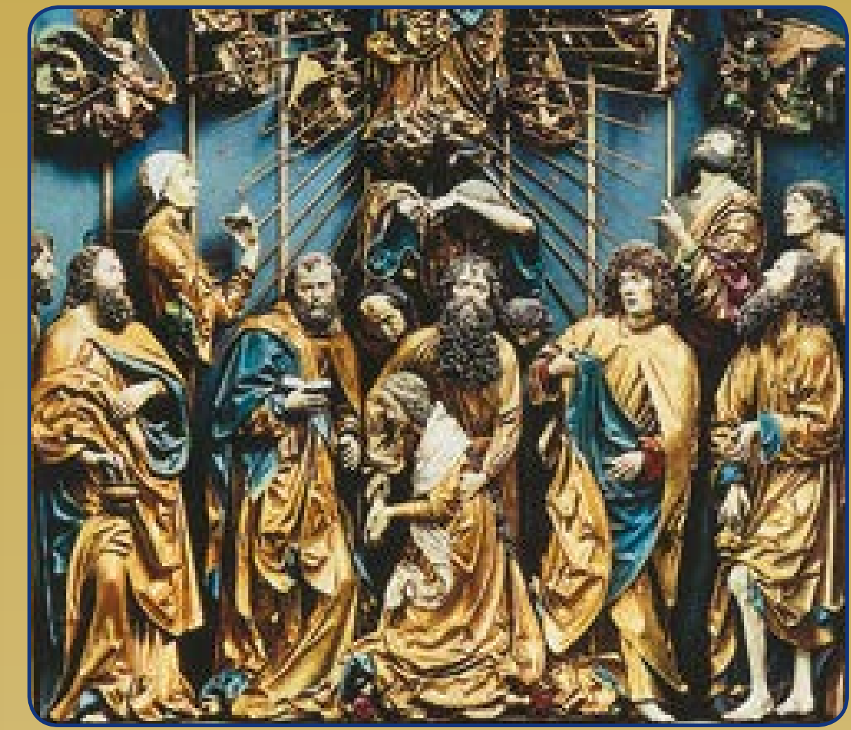
Wit Stwosz, Zaśnięcie Marii Panny z ołtarza mariackiego, Kraków, 1477–1489

Sztuka gotycka była – podobnie jak romańska – sztuką w większości religijną. Jej najbardziej znaczącym wyróżnikiem jest przepełnienie nowym duchem wszystkich znanych i uprawianych dziedzin, czyli architektury sakralnej i świeckiej, rzeźby kamiennej i drewnianej oraz malarstwa ściennego, iluminacji w ręcznie pisanych księgach oraz malarstwa tablicowego.