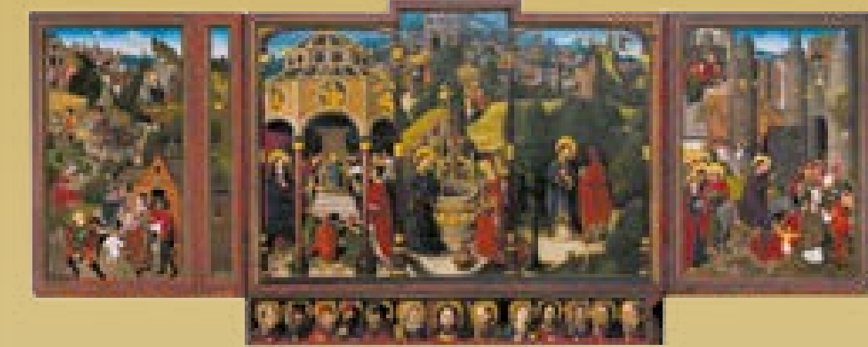
Ołtarz Jerozolimski, ok. 1495–1500

Nowością wprowadzoną przez gotyk są malarstwo tablicowe (czyli obrazy malowane na deskach) oraz polichromowane ołtarze drewniane.